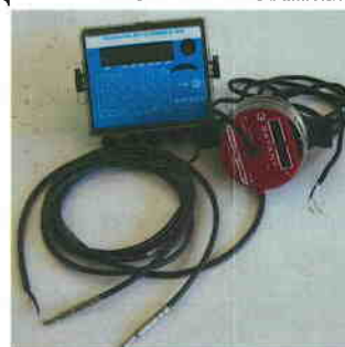
Рис. 7 Теплосчетчик "КСТ-22 Комбик – В"