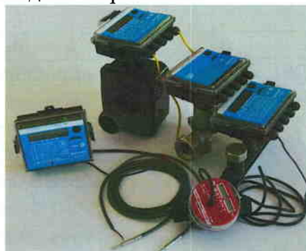
Рис. 2 Теплосчетчик "КСТ-22 ПРИМА (ПРИМА-С) РМД"