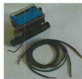
Рис. 5 Теплосчетчик "КСТ-22 Компакт – УР РМД"