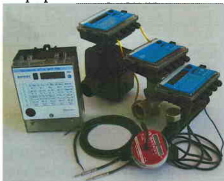
Рис. 1 Теплосчетчик "КСТ-22 ДУЭТ (ДУЭТ-С) РМД"

Фотографии теплосчетчиков и их основных узлов приведены на рис. 1...7.