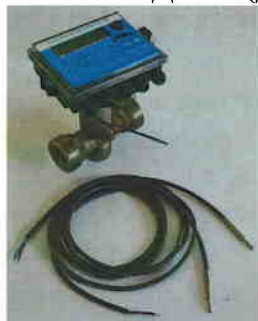
Рис. 3 Теплосчетчик "КСТ-22 Компакт – ВР РМД"