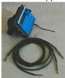
Рис. 6 Теплосчетчик "КСТ-22 Комбик – М", "КСТ-22 Комбик – М РМД"