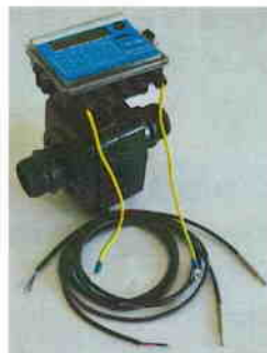
Рис. 4 Теплосчетчик "КСТ-22 Компакт – ЭР РМД"